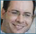
MOTLAGH, Vahid appointed in March 2012 Iran